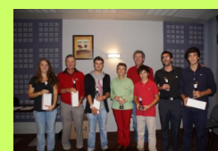
-13 ANS GARCONS